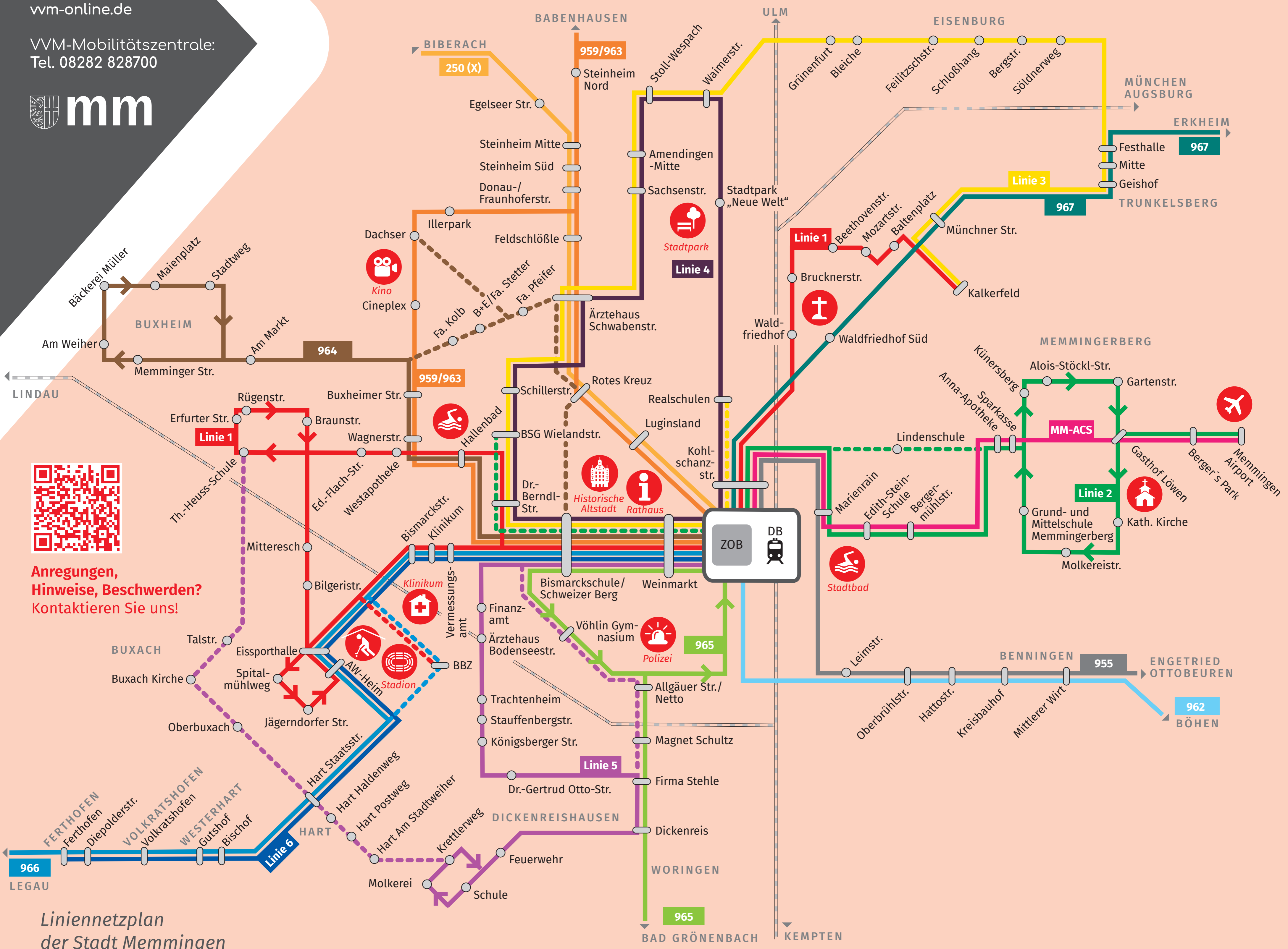
Liniennetzplan der Stadt Memmingen